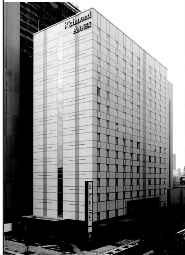
宇都宮駅西口第四B地区第一種市街地再開発事業 リッチモンドホテル宇都宮駅前アネックス 株式会社7・74・Eと共同設計(平成22年12月竣工)

本社/栃木県宇都宮市平出工業団地41-3 TEL:028-662-6480 当社の詳しい情報は で http://www.fujii.co.jp/